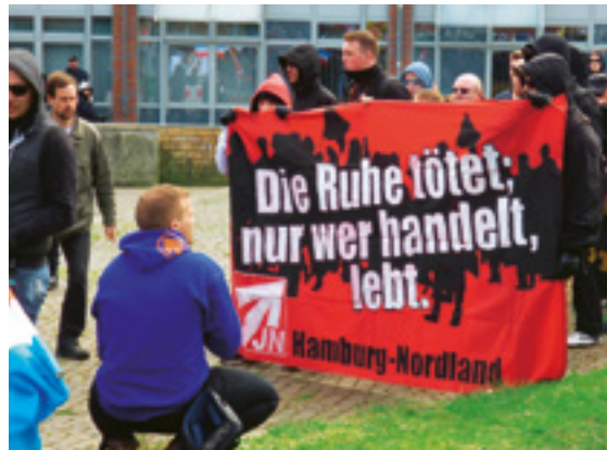
Bei rechtsextremen Kadern und Aktivist*innen – hier dargestellt durch Teilnehmer einer Demonstration in Bad Oldesloe – bringt es erfahrungsgemäß wenig, sich auf Diskussionen im Unterricht einzulassen.

ergreifen. Im Extremfall kann auch eine Strafanzeige erfolgen, wobei hier die pädagogische Intervention gegen die strafrechtliche Sanktion abgewogen werden muss (→FAQ 4.). Neben dem Rückgriff auf das Schulgesetz und die Anweisungen der Schulbehörde kann es sinnvoll sein, zur Orientierung für die Pädagog*innen gemeinsam einen schulinternen Handlungsleitfaden zu entwickeln. Dieser kann für verschiedene Formen von Verstößen abgestufte Handlungsoptionen vorsehen und damit Unsicherheiten und temporäre Handlungsunfähigkeiten vermindern. Sanktionierungen ohne die oben angesprochene inhaltliche Aufarbeitung ebenso wie eine moralisierende Argumentation sollten in jedem Fall vermieden werden. Diese erhöhen die Gefahr Unverständnis und Ablehnung seitens der Schüler*innen zu provozieren. Im schlimmsten Fall kommt es zu Konfrontationen und aktivem Widerstand gegen die „Verbote“ und damit zu einer expliziten Hinwendung zu bzw. Bestärkung von rechtsextremen Ideologien. Mit Blick auf rechtspopulistische bis rechtsextreme „Protestbewegungen“ ist dies ein nicht unerheblicher Aspekt: Unter dem Stichwort der „Meinungsdiktatur“, die entgegen der Behauptung von Meinungs-