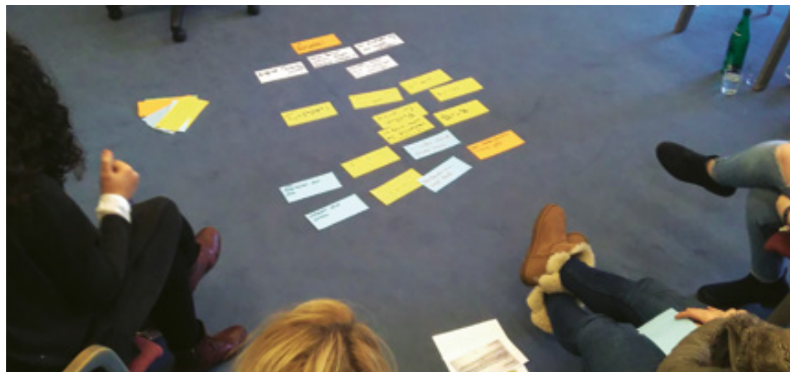
Die Auseinandersetzung mit Vorurteilen und Diskriminierung sollte idealerweise auch schon Thema sein, bevor „etwas“ passiert ist.

An dem Projekttag werden anhand von Beispielen und mit verschiedenen Methoden (Stillarbeit, Kleingruppenarbeit, Diskussionsrunden mit der gesamten Klasse, etc.) Abwertungen und Vorurteile beschrieben und herausgearbeitet mit dem Fokus: „Was macht das mit den Betroffenen?“ und „Wie würdet ihr reagieren?“.