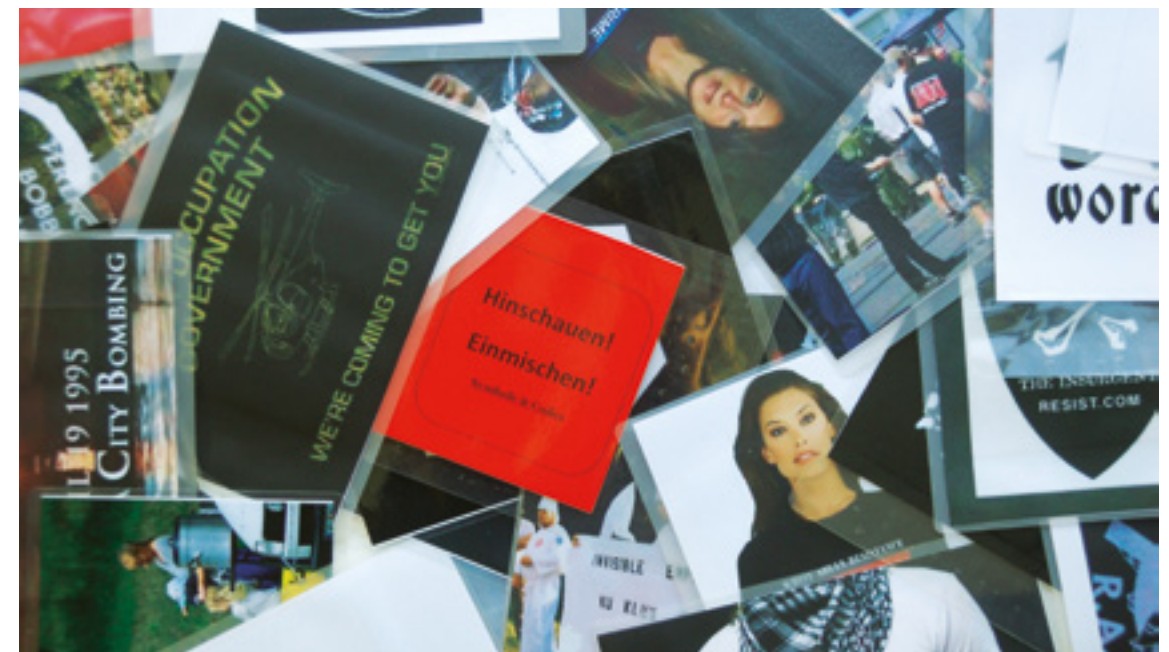
Es gibt unzählige rechtsextreme Symbole, Codes und Kleidungsmarken. Für eine eindeutige Zuordnung gilt es genau hinzuschauen.

Greifen sie ein! Ein Ignorieren rechtsextremer Symbole, Aufkleber o.Ä. trägt zur Normalisierung rechtsextremen Lifestyles und damit zu einer Akzeptanz entsprechender Einstellungen und Verhaltensweisen bei den Schüler*innen bei. Auch wenn die jeweiligen Lifestyleprodukte strafrechtlich nicht relevant sind, sollten Sie klare Gegenpositionen beziehen. Dabei sollten Sie aber nicht kommentarlos verbieten, da dies schnell zu dem Gefühl führen kann, bloß von den Lehrenden gegängelt zu werden. Somit können rechtsextreme Einstellungen sogar verstärkt werden. Argumentieren Sie stattdessen inhaltlich! Das Zeigen oder Tragen rechtsextremer Symboliken oder das Vorspielen rechtsextremer Musik kann darüber hinaus häufig mit dem Hinweis auf die Hausordnung (Unzulässigkeit verbaler Gewalt, angemessene Kleidung, diskriminierungsfreies Umfeld) oder das Schul-