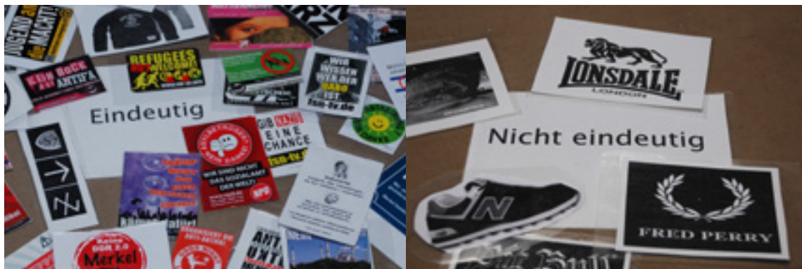
Es gibt Kleidungsmarken, Symbole und Zahlencodes, die eindeutig rechtsextrem sind. Andere werden von Rechtsextremen lediglich getragen, genutzt und ideologisch besetzt.

Es gibt unzählige rechtsextreme Symbole und Marken. Zu erkennen sind einige an ihren Inhalten (bspw. „Nationaler Sozialist“ oder „Todesstrafe für Kinderschänder“), andere an ihrem Style (Verwenden von Symbolen des Nationalsozialismus). Die Broschüre „Versteckspiel“ (ASP 2013) stellt zahlreiche neonazistische Symbole und Marken vor und erklärt sie. Das dort gesammelte Wissen kann Ihnen als Grundlage für Diskussionen mit Schüler*innen dienen. Außerdem bieten die Regionalen Beratungsteams gegen Rechtsextremismus Workshops zu diesem Thema an.