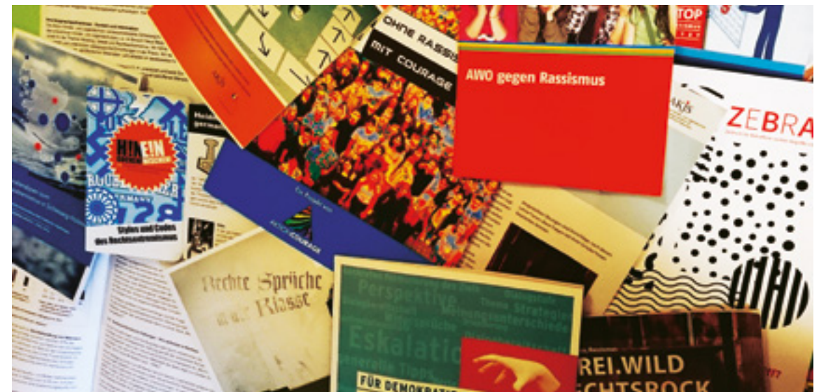
Organisationen aus Schleswig-Holstein bieten neben Beratung auch Materialien zum Umgang mit Rechtsextremismus an.

Sie sollten dabei sensibel für jegliche Form der Diskriminierung sein. Von Ihrer Haltung zu diesen Themen geht eine Vorbildwirkung für die Klasse aus. Positionieren Sie sich dazu, stärken Sie die Betroffenen und beziehen Sie die gesamte Klasse ein. Auch das Klassenzimmer darf kein Raum sein, in dem Menschen bei Diskriminierungen wegsehen und nicht eingreifen.