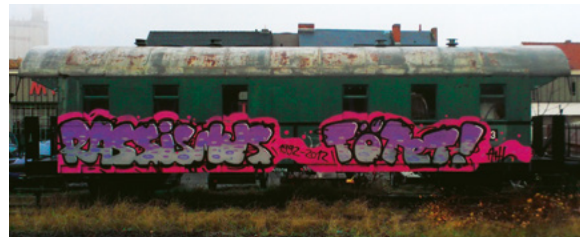
Unabhängige Initiativen gehen davon aus, dass von 1990 bis 2015 mindestens 179 Menschen in Deutschland durch rechtsextreme und rassistische Gewalt getötet wurden (vgl. MUT 2015).

tendieren, eine Schlüsselrolle zu. Die Demokrat*innen bzw. demokratischen Positionen gilt es zu stärken, sie stehen im Mittelpunkt der pädagogischen Arbeit. Gleichzeitig sollten der Schutz und die Unterstützung von potentiellen und tatsächlichen Betroffenen von Diskriminierung, Beleidigungen, Bedrohungen bis hin zu körperlicher Gewalt immer im Fokus stehen. Rechtsextreme Positionen sollten Lehrer*innen Anlass sein, sich offensiv mit dem Thema auseinander zu setzen und es nicht zu tabuisieren. Selbstvorwürfe sind hier fehl am Platze, denn wie gezeigt wurde, treten rechtsextreme Positionen unabhängig von Schule oder Lehrer*in auf. Die Ursachen dafür, dass Jugendliche mit