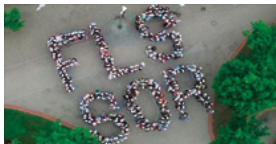
Partizipation als Prinzip kann auf vielfältige Arten in den Schulalltag integriert werden. Eine Möglichkeit ist die Teilnahme am Programm Schule ohne Rassismus (SoR).

Thema im Unterricht: In jedem Unterricht kann präventiv zu dem Thema gearbeitet werden – das ist keine Aufgabe, die nur den Fächern Geschichte, Sozialkunde oder Politik zugewiesen werden sollte. Zwar ist es auf den ersten Blick einleuchtender, sich im historischen Kontext mit Rechtsextremismus/Nationalsozialismus zu beschäftigen – und eine Analyse der NPD -Wahlprogramme bietet sich sicherlich besonders im Politikunterricht an. Gleichzeitig ist Rechtsextremismus ein vielschichtiges Phänomen, an das sich über Themen wie Sexismus (z. B. in Bezug auf Literatur im Deutsch- oder Englischunterricht), Homophobie (Sexualkunde mit Verknüpfung zu bspw. Euthanasie), Ausgrenzung (denkbar spielerisch bspw. im Sportunterricht) u.a. angenähert werden kann. Hierbei ist es wichtig, dass die Lehrenden selbst eine Positionierung gefunden haben