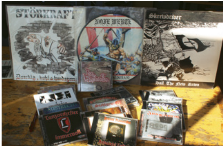
Musik ist ein zentrales Element rechtsextremer Erlebniswelten und dient unter anderem dazu, Jugendliche für rechtsextreme Inhalte zu begeistern.

Ideologiedichte analysiert werden, also wie weit die*der betreffende Jugendliche in die rechte Szene involviert ist und wie ausgeprägt die ideologische Zustimmung ist. Auf Basis dieser Analyse lässt sich idealtypisch in Sympathisant*innen, Mitläufer*innen, Aktivist*innen und Kader unterscheiden (vgl. VDK / MBR 2006: 84f.; → Anhang 2 ).