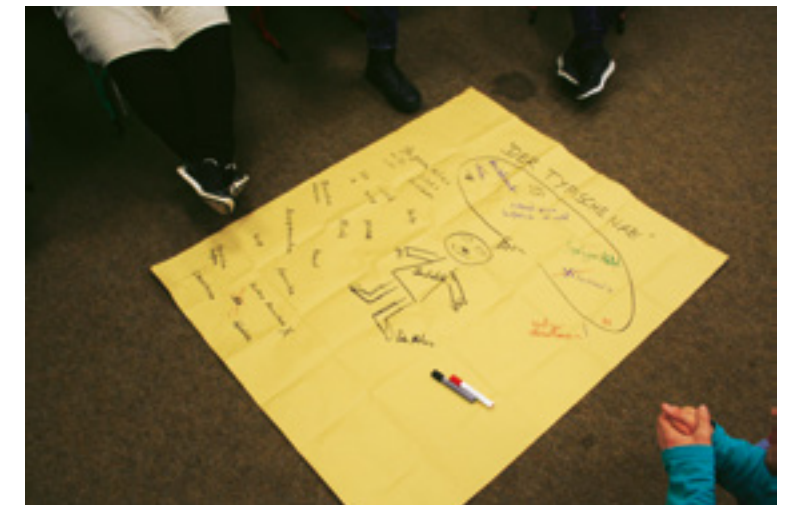
Übung zur Auseinandersetzung mit Vorstellungen über Rechtsextreme an einer Berufsschule.

Die Möglichkeiten in Form schulischer Wissensvermittlung zu intervenieren bieten sich bei den meisten Berufsschüler*innen letztmalig, bevor sie ins Berufsleben entlassen werden. Die dabei möglichen Handlungsalternativen unterscheiden sich wenig von den bereits benannten Möglichkeiten an anderen Schultypen. Die Spezifika der Berufsschule liegen vor allem in der Chance des Aufgreifens der spezifischen Lebenssituationen, die sich für die Auszubildenden ergeben. Es besteht eine reale Konkurrenzsituation um gesellschaftliche und soziale Güter. Eine subjektiv empfundene Benachteiligung, bspw. aufgrund