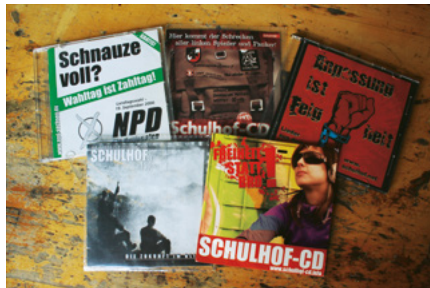
Bis vor wenigen Jahren versuchten Rechtsextreme immer wieder durch so genannte Schulhof-CDs ihre Ideologie unter junge Menschen zu bringen. Heute tritt Rechtsextremismus in der Schule meist in anderer Form auf.

tungen vor ganz verschiedene Herausforderungen. Dies verwundert nicht weiter, belegen verschiedene Studien aus den letzten Jahren doch, dass rechtsextreme Einstellungen bis in die Mitte der Gesellschaft reichen (vgl. u.a. Zick/Küpper/Krause 2016). Fünf Prozent der Befragten vertreten nach der sogenannten „Leipziger Mitte-Studie“ (vgl. Kiess/Decker/Brähler 2016) ein geschlossen rechtsextremes Weltbild. In Schleswig-Holstein liegen diese Werte laut einer vom Innenministerium in Auftrag gegebenen Studie (vgl. RfK 2016) noch etwas höher als im gesellschaftlichen Durchschnitt: So zeigen acht Prozent der befragten Schüler*innen eine rechtsorientierte 2 bis rechtsextreme Haltung, bei Berufsschüler*innen liegt der Wert bei elf Prozent 3 (→ Kapitel 2 ).