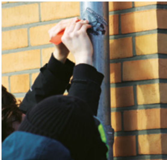
Ein möglicher Umgang mit rechtsextremen Vorfällen kann das gemeinsame Entfernen von Propagandamaterialien sein.

Über die generellen Interessensvertretungen der Schüler*innen hinaus besteht zudem die Möglichkeit, freiwillige Arbeits- bzw. Projektgruppen zu fördern. Besonders kontinuierliche Arbeitsgruppen aus Schüler*innen und pädagogischen Fachkräften sind sinnvoll, um die stetige Arbeit im Themenfeld Rechtsextremismus/Demokratie zu gewährleisten. Diese können sich mit der Planung und Umsetzung von verschiedenen Veranstaltungen, Maßnahmen, Projekten etc. beschäftigen und sie nach der Umsetzung auch auswerten (vgl. Hammerbacher 2014: 14f., 20). Eine Möglichkeit, wie darüber hinaus das Thema auch von Seiten aktiver Schüler*innen