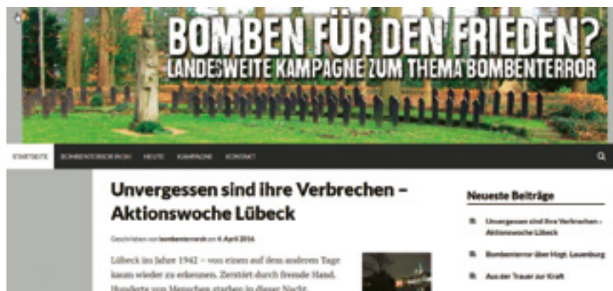
Der relativierende Bezug auf deutsche Opfer alliierter Angriffe im zweiten Weltkrieg stellt für Teile der rechtsextremen Szene nach wie vor einen wichtigen Agitationspunkt dar.

Abschließend werden Strategien diskutiert, wie das erarbeitete Wissen – in einem politischen und gesellschaftlichen Feld, dass aktuell viele Veränderungen unterworfen ist – aktuell gehalten werden kann. Damit die Arbeitsbelastung für einzelne Lehrer*innen nicht zu groß wird, wird auf dem Schulserver ein Ordner angelegt, der aktuelle Informationen zum Thema enthält. Wie dieser in der weiteren Zukunft betreut werden soll, wird von einer gegründeten Arbeitsgruppe von Lehrer*innen unterschiedlicher fachlicher Richtungen erarbeitet. Auf dieser inhaltlichen Grundlage und mit dem im Argumentationstraining erprobten „Handwerkszeug“ sehen sich die Lehrer*innen besser auf Situationen im Unterricht vorbereitet, in denen Ihnen von Schüler*innen mit Vorurteilen und Hetzparolen gegen Geflüchtete begegnet wird.