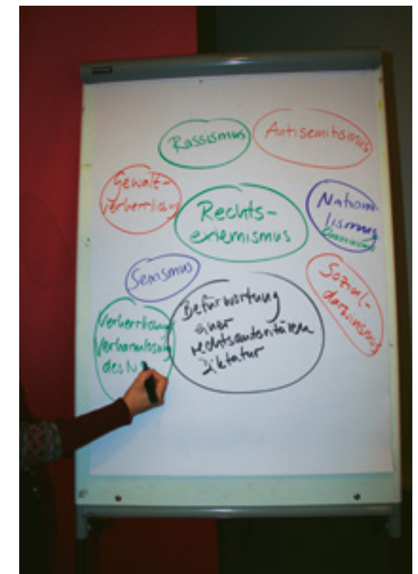
In Seminaren definieren wir Rechtsextremismus anhand verschiedener Elemente rechtsextremen Denkens.

Neutralität keineswegs mit einer „Werteneutralität“ zu verwechseln, die jeglicher Meinung – egal wie menschenverachtend diese ist – vollkommen indifferent gegenüber steht. Vielmehr werden die den Schüler*innen zu vermittelnden Werte im