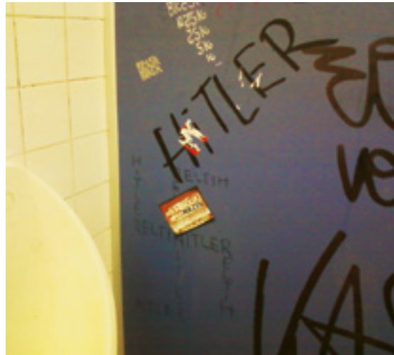
Rechtsextremismus kann im Schulkontext offen oder versteckt auftreten. Auf Schultoiletten finden sich häufig rechte Symbole.

Gemeinsam mit dem Geschichtslehrer wird die Projektwoche geplant. Diese umfasst zunächst interaktive Elemente zum Ende der Weimarer Republik und eine allgemeine Einführung zum Nationalsozialismus. Anschließend können sich die Schüler*innen Gruppen zuordnen, die sich auf Grundlage vorbereiteter Materialien (Texte, Audio- und