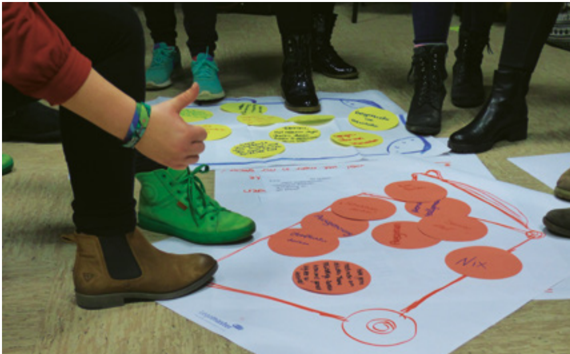
Diskussionsrunden und Gruppenarbeiten sind Teil politischer Bildungsarbeit an Schulen.

Schulgesetz Schleswig-Holsteins eindeutig formuliert: So soll nach § 4 Schule unter anderem „die Offenheit des jungen Menschen gegenüber kultureller und religiöser Vielfalt, den Willen zur Völkerverständigung und die Friedensfähigkeit“ (§ 4 Abs. 6 SchulG SH) fördern. Außerdem sollen junge Menschen „zur freien Selbstbestimmung in Achtung Andersdenkender, zum politischen und sozialen Handeln und zur Beteiligung an der Gestaltung der Arbeitswelt und der Gesellschaft im Sinne der freiheitlichen demokratischen Grundordnung“ (ebd.) angeleitet werden.